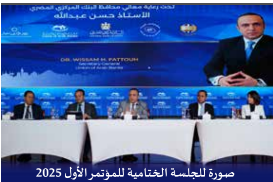
صورة للجلسة الختامية للمؤتمر الأول 2025