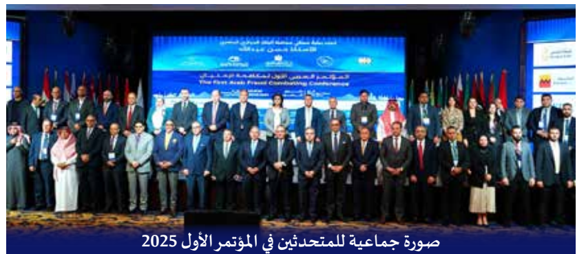
صورة جماعية للمتحدثين في المؤتمر الأول 2025