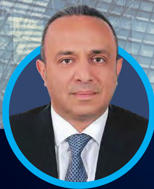
الدكتور وسام حسن فتوح الامين العام