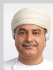
Cheikh Waleed bin Khamis Al Hashar (Sultanat d'Oman)