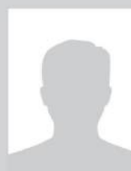
Fonds Monétaire Arabe (Membre observateur)