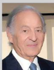
Othman Benjelloun (Maroc)