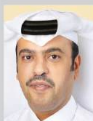
Abdulla Mubarak Al Khalifa (Qatar)