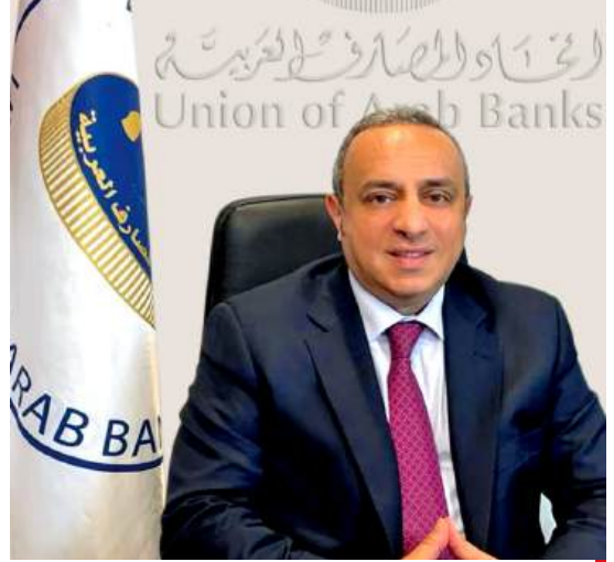
د. وسام فتوح الأمين العام لإتحاد المصارف العربية

ولا شك في أن المصارف في المملكة الأردنية الهاشمية، كما في دولة فلسطين، تسير على نحو سليم ومتكافئ في مجال تطبيق معايير الحوكمة ومكوناتها الأساسية، في عالم تتسارع فيه التحديات البيئية والإقتصادية والإجتماعية، إذ لم تعد الشركات والمصارف كيانات معزولة عن محيطها، بل أصبحت مسؤولياتها تتجاوز تحقيق الأرباح إلى خلق قيمة مستدامة لجميع أصحاب المصلحة. وفي هذا السياق، برزت معايير الإستدامة البيئية والإجتماعية والحوكمة (ESGs) كإطار شامل يُعيد تعريف النجاح المؤسسي وفق أبعاد أكثر شمولية وتأثيراً.