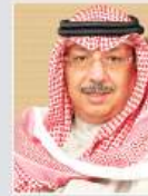
الشيخ محمد الجراح الصباح (الكويت)