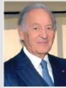
عثمان بن جلون (المغرب)