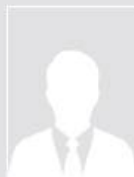
صندوق النقد العربي (بصفة مراقب)