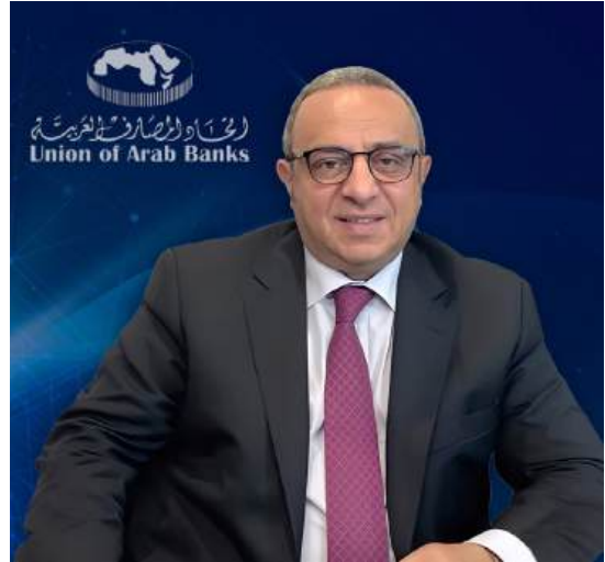
د. وسام فتوح الأمين العام لإتحاد المصارف العربية

وإنطلاقاً من هذا الواقع، نظم إتحاد المصارف العربية مؤتمراً مصرفياً عربياً - أميركياً رفيع المستوى تحت عنوان «الحوار المصرفي العربي - الأميركي» وذلك بهدف مناقشة التحديات المحورية التي تواجه المصارف العربية في مجالات مكافحة غسل الأموال وتمويل الإرهاب وتعزيز الإمتثال للمعايير الدولية، إلى جانب تعزيز قنوات الحوار والتعاون بين المصارف العربية ونظيراتها الأميركية، والبنوك المراسلة، والجهات الحكومية والرقابية الأميركية، بما يساهم في ترسيخ جسور التواصل وتطوير آفاق العمل المصرفي المشترك.