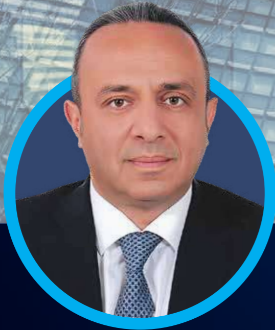
الدكتور وسام حسن فتوح الامين العام